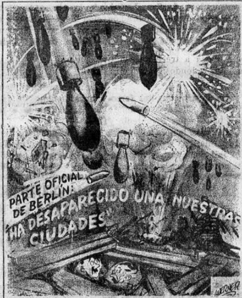
Werner en el Chicago Times

No dudamos en qué el cultivo de la balsa en Costa Rica será otra nueva fuente de riqueza para el país.