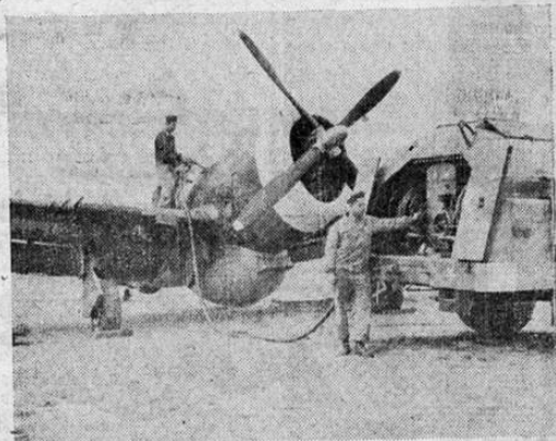
Un poderoso Thunderbolt de combate estadounidense, toma combustible en su base en algún punto de la Gran Bretaña, preparándose de nuevo para demostrar su superioridad combativa.